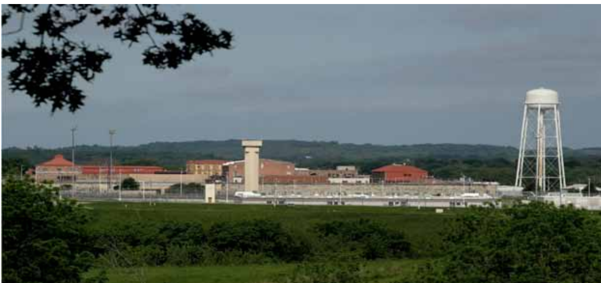
The Lansing Correctional Facility in Lansing, Kan. Officials are offering inmates shots in state facilities in Kansas.

https://www.humanite.fr/dominique-simonnot-cest-une-catastrophe-lorsque-le-virus-entre-dans-les-prisons-700922