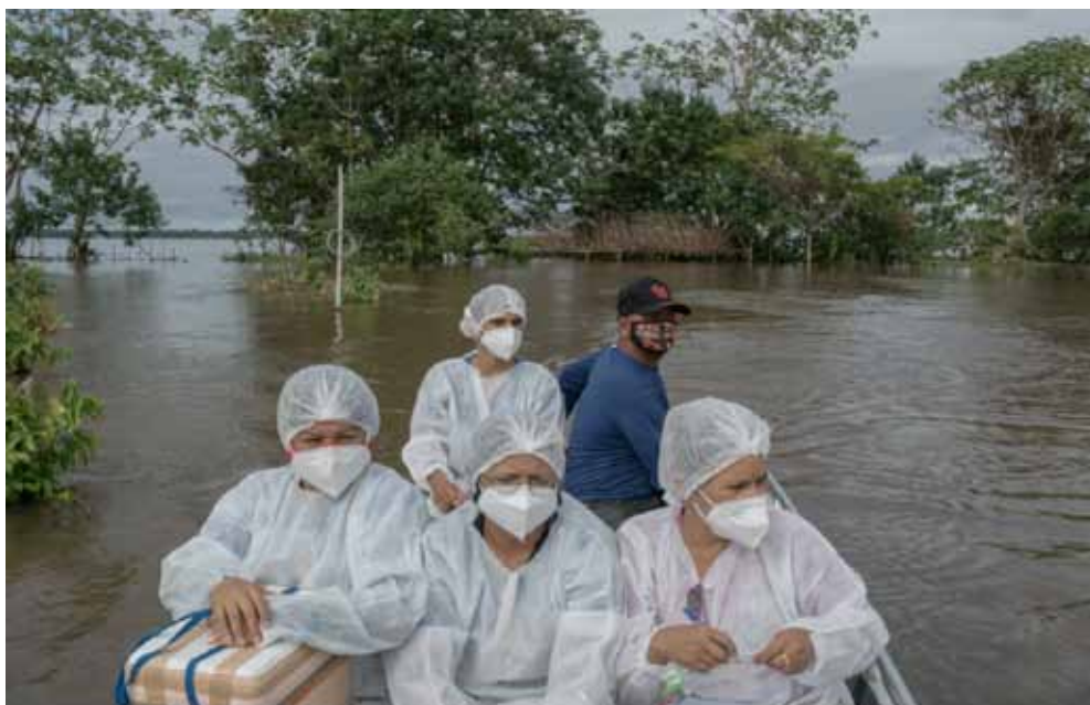
Health care workers traveled by boat this month to vaccinate residents that live on the Manacapuru River

Le photographe Mauricio Lima a sillonné le Brésil pour photographier la pandémie. Ses photos sont des témoignages de la souffrance mais aussi des lueurs d'humanité.